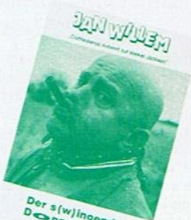
Der s(w)ingende Doppelzentner