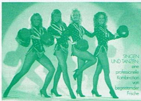
SINGEN UND TANZEN eine professionelle Kombination von begeistender Frische