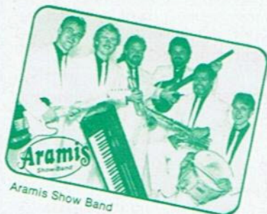
Aramis Show Band